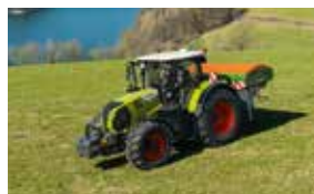
ARION 660. 210 PS. Kraft trifft Intelligenz.

1 Woche, 40 h 45 €/h* 1 Monat, 125 h 42 €/h* 2 Monate, 225 h 39 €/h*