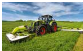
AXION 930. Pure Leistung mit 350 PS.

1 Woche, 40 h 55 €/h* 1 Monat, 125 h 52 €/h* 2 Monate, 225 h 49 €/h*