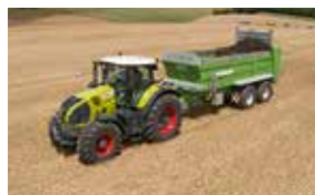
AXION 870. 300 PS. Und viele Vorteile.

1 Woche, 40 h 55 €/h* 1 Monat, 125 h 52 €/h* 2 Monate, 225 h 49 €/h*