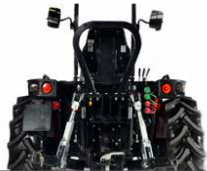
Anbau der 1. Kategorie