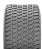
29 x 12,50-15 Rasenbereifung