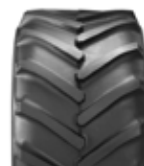
31 x 15,50-15 Grünland