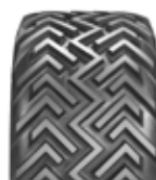
31 x 15,50-15 Alianz